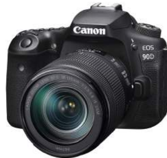
Canon EOS 90D + Kit-Objektiv