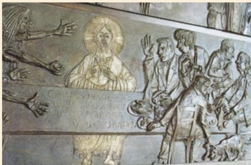
Die Tür der Göppinger Stadtkirche zeigt Stationen aus dem Leben Jesu, thematisiert aber auch aktuelle gesellschaftliche Probleme. Eingeweiht wurde das Kunstwerk am 22. Februar 1998.