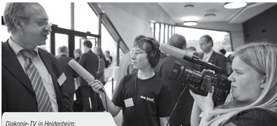
Diakonie-TV in Heidenheim: Jugendliche interviewten die Synodalen bei der Frühjahrstagung.