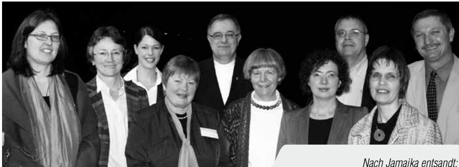
Nach Jamaika entsandt:

Die günstige Entwicklung am Arbeitsmarkt erreiche Langzeitarbeitslose und Arbeitslose mit Vermittlungshemmnissen nur begrenzt, sagte Dieter Kaufmann, Vorstandsvorsitzender des Diakonischen Werks Württemberg (DWW). Aufgrund statistischer Verzerrungen müsse man zudem davon ausgehen, dass der tatsächliche Anteil Langzeitarbeitsloser weitaus höher ist, als bisher wiedergegeben. Das DWW entwickle unterschiedliche Aktivitäten, um die Lage der betroffenen Menschen zu verbessern. Öffentlich geförderte Beschäftigung sollte ausgebaut werden, forderte Kaufmann. Zur Finanzierung könnten die passiven Leistungen wie Arbeitslosengeld II und die Kosten der Unterkunft beitragen. Unternehmen sollten für die Beschäftigung Langzeiterwerbsloser Lohnkostenzuschüsse erhalten.