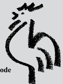
Frühjahrs- tagung 2007 der Landessynode

In Zukunft soll die Ordination auch mit der Übernahme eines konkreten Dienstauftrags verbunden sein.