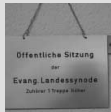
Die Landessynode trifft sich zu ihrer nächsten Tagung vom 27. bis 29. März 2003 in Stuttgart.

Die Synode bittet das Kirchenamt darum, diese Erklärung ins Englische zu übersetzen und den Partnerkirchen in den USA sowie den Kirchen im Irak zu übersenden.