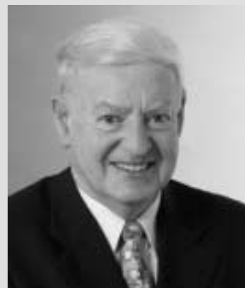
Landesbischof Gerhard Maier: „Bei der Frage Krieg oder Frieden geht es um ganz elementare ethische Grundfragen.“

tigste Zugang zum Frieden“, so der Bischof. Gleichzeitig warnte er vor dem Aufbau neuer Feindbilder. Hussein habe eine unberechenbare Bedrohung dargestellt, seine Waffen lange Zeit Inspektionen entzogen und sich über die Resolutionen der UN hinweg gesetzt. Wer ihn jetzt einfach zum Opfer mache und den amerikanischen Präsidenten zur Verkörperung des Bösen, „der setzt sich selbst ins Unrecht und entzieht sich der Verantwortung für den Frieden“. Nicht zuletzt gelte es jetzt den Blick nach vorne zu richten und nach Möglichkeiten zu suchen, noch während der Kampfhandlungen Hilfsgüter bereitzustellen. Die kirchlichen Hilfswerke hätten Entsprechendes eingeleitet. Christen dürften nicht bei Klage und Trauer stehen bleiben. Sie müssten nach Wegen zum Handeln suchen.