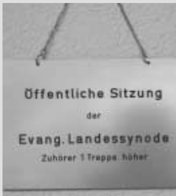
Die Landessynode trifft sich zu ihrer nächsten Tagung von 10. bis 12. Juli im Stuttgarter Hospitalhof.

Er warb außerdem für eine größere Aufmerksamkeit für die kirchliche Familienbildung. Die PISA-Studie habe die hohe Bedeutung der Familie bestätigt. „Die Studie macht deutlich, wie entscheidend und prägend der familiäre Kontext ist.“ Deshalb bräuheten die Familien mehr Unterstützung. Die Familienbildung müsse sich als Netzwerk verstehen. „Sie muss die hervorragende kirchliche Infrastruktur von der Krabbelgruppe bis hin zur Elternarbeit nutzen“, so der Bildungsdezernent.